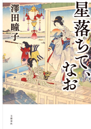
『星落ちて、なお』 著者：澤田瞳子 出版社：文藝春秋