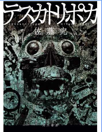
『テスカトリポカ』 著者：佐藤 究 出版社：KADOKAWA

機械科3年の課題研究の一環として、学校貢献班の3人が雑誌コーナーの棚の移動を手伝ってくれました！図書館のすみっこにあった雑誌コーナーですが、入口近くに移動してもらったことで、手に取ってくれる人が増えたような気がします。学校貢献班のみなさん、ありがとうございました！