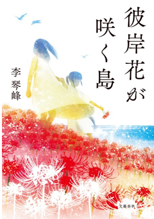
『彼岸花が咲く島』 著者：李琴峰 出版社：文藝春秋